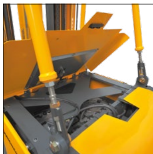
Tapa de batería