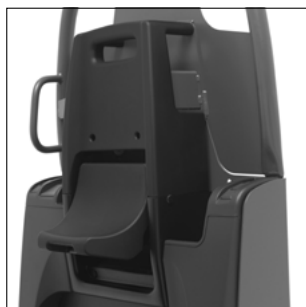
Respaldo con asiento abatible