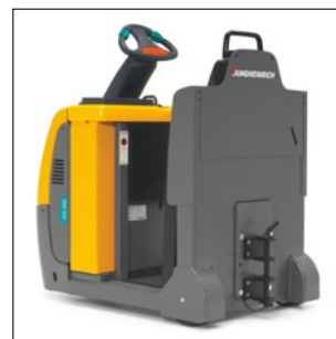
Diferentes acoplamientos disponibles (opcionales)