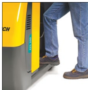
Subir y bajar sin esfuerzos