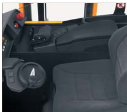
Puesto de mando ergonómico