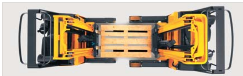
Un chasis apropiado para cualquier aplicación

El ancho de chasis apropiado para cada aplicación. ETV 110/112 con un ancho exterior de 1120 mm para estanterías drive-in o el almacenaje en bloque. Es posible tomar un europallet en sentido longitudinal entre los brazos portadores. ETV 114/116 con un ancho exterior de 1270 mm para altas capacidades de carga a grandes alturas de elevación.