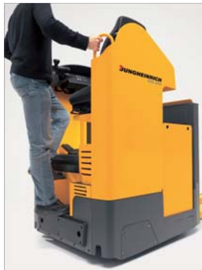
Acceso seguro mediante peldaño bajo y estribo