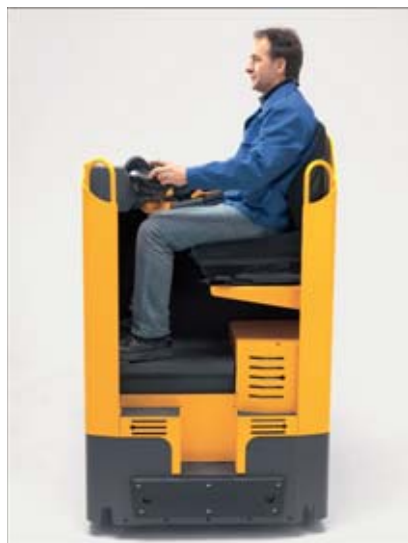
Posición de asiento confortable con mucho espacio