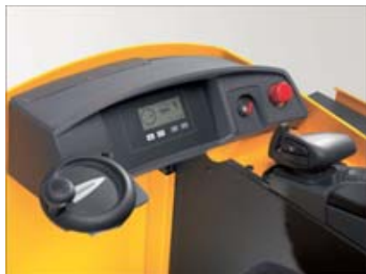
Unidad de mando

La palanca de mando que activa todas las funciones hidráulica, inversor de dirección de marcha y claxon.